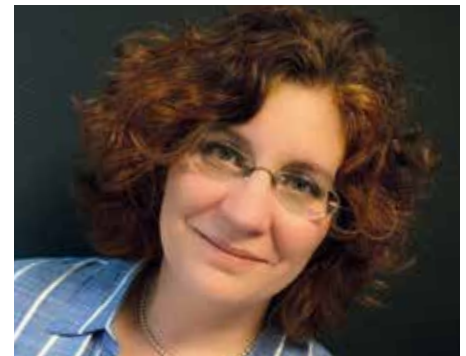
Botschafterin vR und MGG

Bei visibleRuhr ist er für den Aufbau der Key Accounts verantwortlich und verbindet als Projektleiter seine IT- und kaufmännischen Fähigkeiten. Bei der Schülergenossenschaft GoFit eSG ist er Aufsichtsratsmitglied und hat die Gründungsphase beratend begleitet.