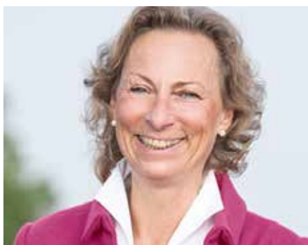
BGM-Expertin / Podium