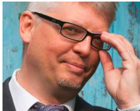
Vorstand visibleRuhr eG